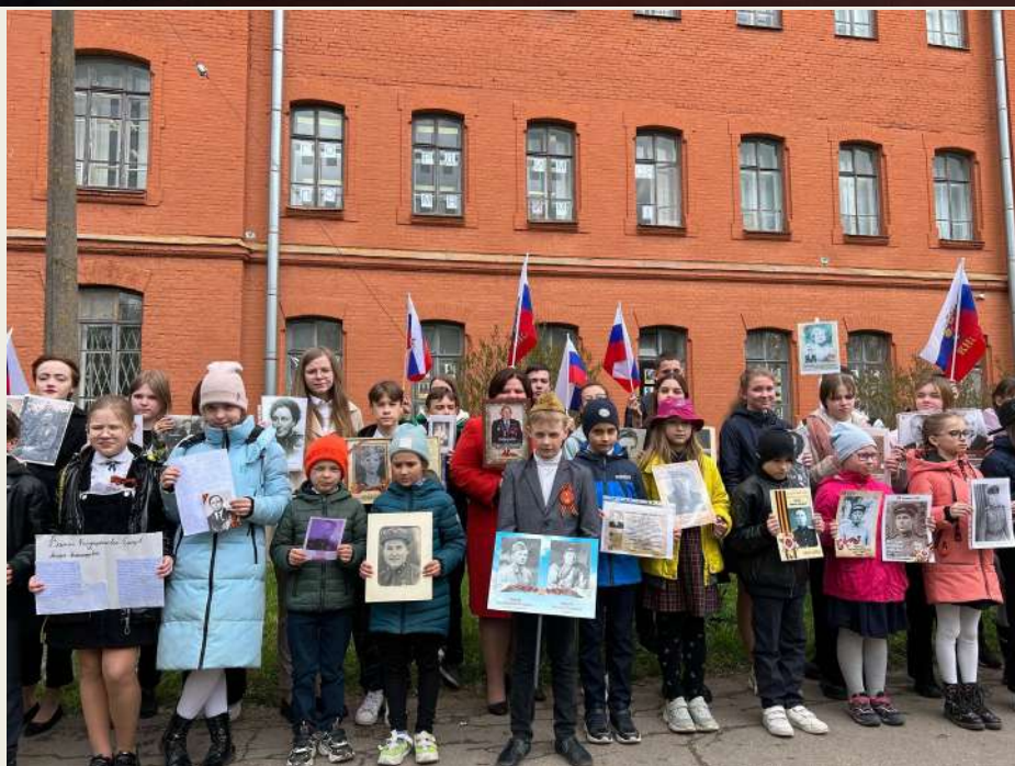
Акция «Бессмертный полк 409»