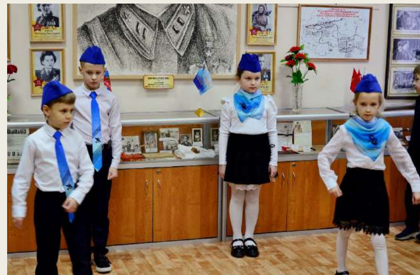
Почетная Вахта Памяти, посвященная Марине Расковой в январе 1-е классы