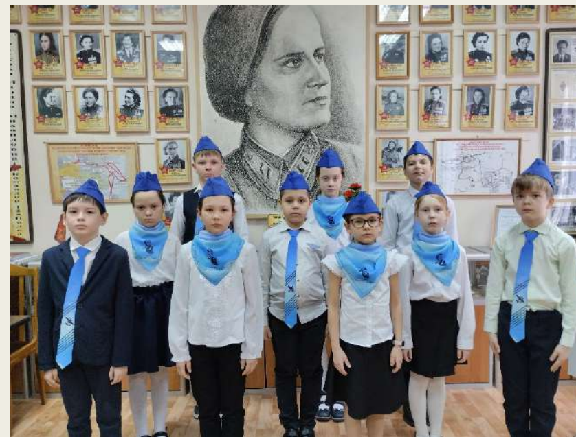
Почетная Вахта Памяти, посвященная Марине Расковой, 28 марта 2-4 классы